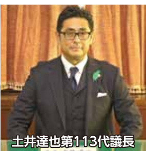
土井達也第113代議長