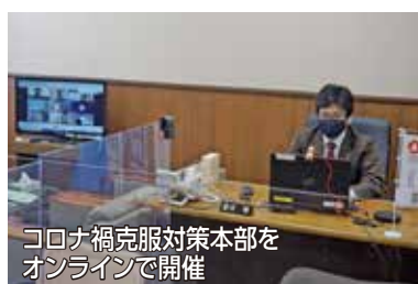
コロナ禍克服対策本部をオンラインで開催

コロナに関して府民から寄せられる疑問や要望等について、毎日、関係部署に問合せを行い迅速な対応を要求。専用のアカウントを開設して府民の声を収集分析し、新型コロナ関連対策の施策案等を研究・立案・レポート作成。