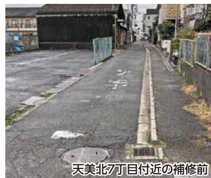
天美北7丁目付近の補修前