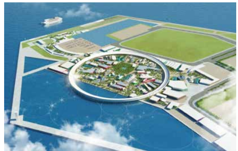
2025大阪・関西万博会場イメージ図