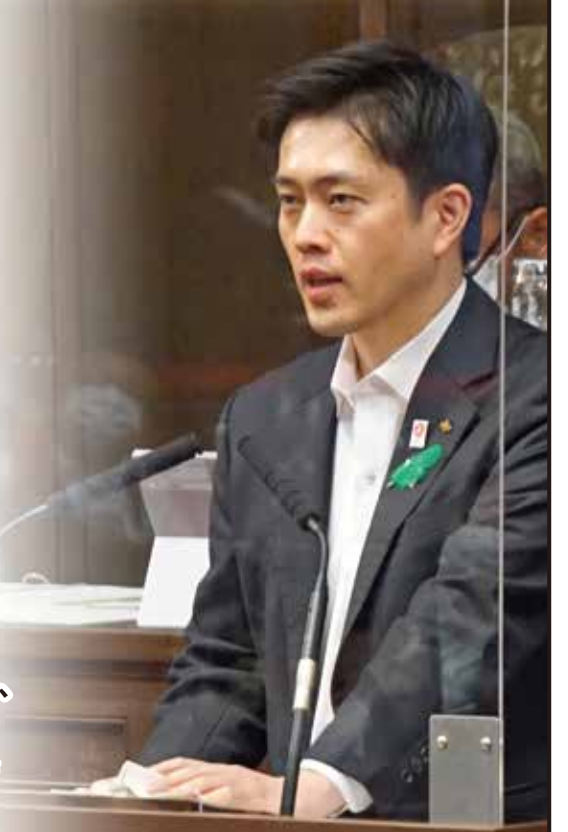
提出議案を説明する 吉村洋文知事

維新府議団も、吉村知事を支えながら、ウィズコロナからポストコロナに向けての取組みに全力を尽くしてまいります。