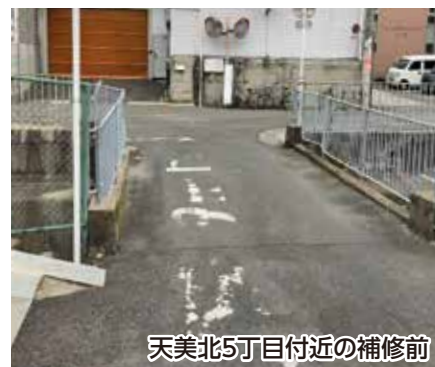
天美北5丁目付近の補修前

松原市の連合町会長、町会長から大阪府警本部管轄の「道路補修と交通安全対策について」の要望を受け停止線、並びに止まれ(路面標示)を補修して頂きました。