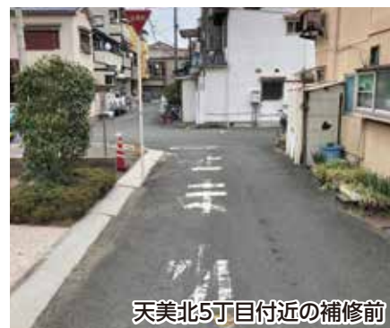
天美北5丁目付近の補修前