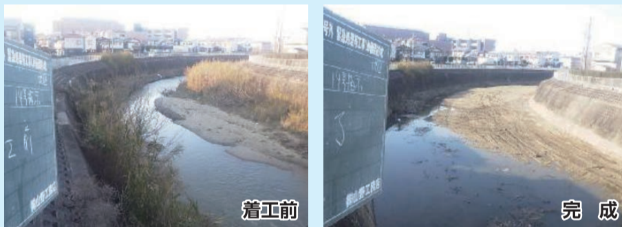
一級河川西除川河床整生2021/2/12