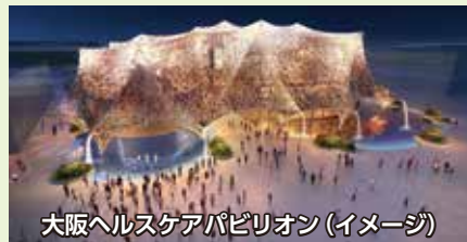
大阪ヘルスケアパビリオン(イメージ)