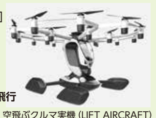
空飛ぶクルマ実機(LIFT AIRCRAFT)