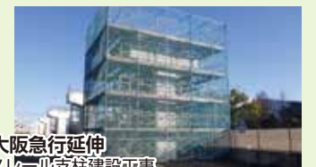
北大阪急行延伸モノレール支柱建設工事