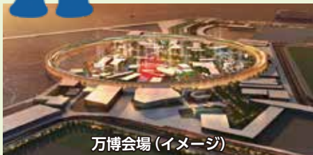
万博会場(イメージ)

◆万博成功に向けた準備の加速 2025年大阪・関西万博の推進 [78億5,390万円] 会場建設費や大阪メトロ中央線の輸送力増強事業費を負担するとともに、機運醸成や参加促進、大阪パビリオンの建設、展示の企画などの事業を実施。